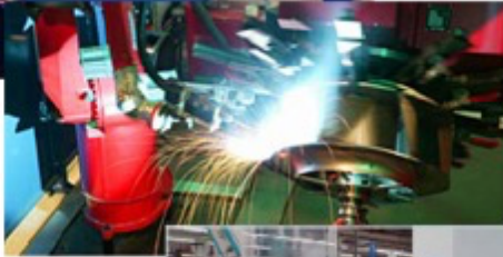
Hassas Kaynak yapan mükemmel robotlar