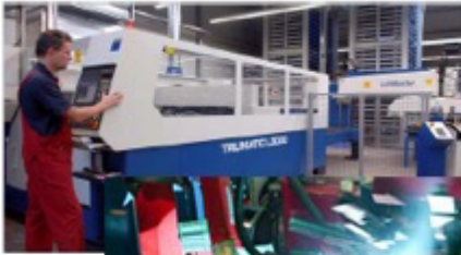
Otomatik lazerli kesim makineleri

Parça Üretimleri Almanya ve İtalya'da kaynak robotları, otomatik montaj makineleri, baskı ve sıvama pres makinelerinden oluşturmaktadır. Bilgisayar altyapısına dayanan kontrollü süreç dahilinde kısa sürede hatasız imalat ve düşük maliyetli üretim süreci kaçınılmaz olmuştur. Montajın tamamı Türkiye'de gerçekleşmektedir.