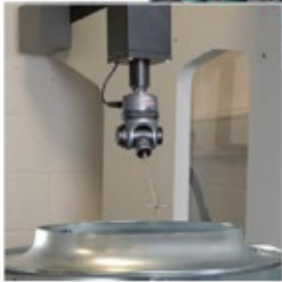
Kalibrasyon ölçümü ile son kontrolleri yapılması